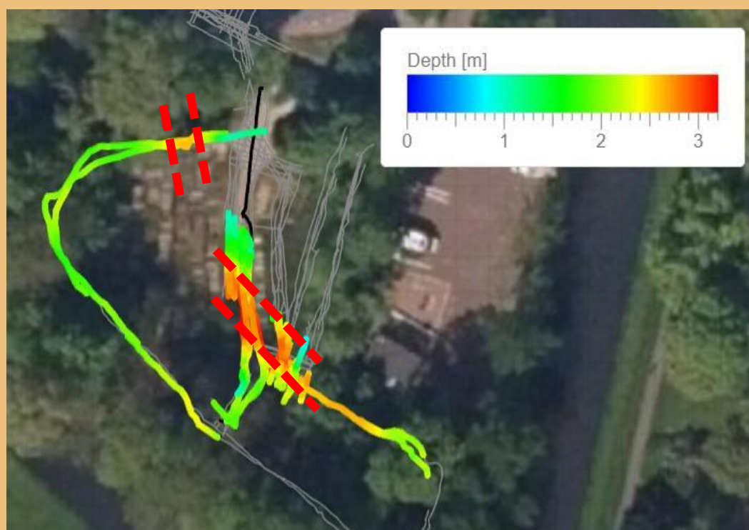
Afbeelding 14: bovenaanzicht diepteverloop

Door deze aan te geven met een kleur in diepteverschil wordt het ondergrondse reliëf enigszins duidelijk. Deze heeft hoogst waarschijnlijk te maken met de herinrichting van de oude begraafplaats. Door de herinrichting van het voormalig bastion en de herinrichting/uitbreiding van de begraafplaats zelf heeft ertoe geleid dat de locatie zeer sterk verrommeld is. Er is veel met grond heen en weer geslept.